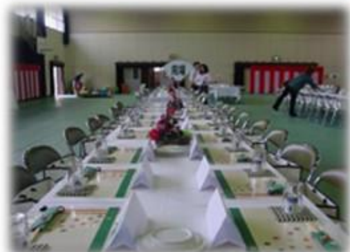
◆今回はPTAのみなさんで手作りしたランチョンマットやコースターなどで温かみのある演出になりました