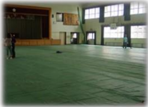
◆体育館の床板を傷つけないように・・・