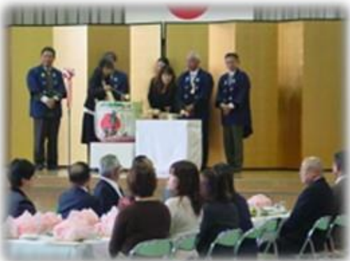
◆式典の醍醐味、お鏡割り！ 皆様おいしくいただきました