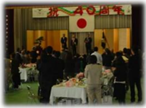
◆手作り感の出た式典になり、皆様より感謝のお言葉をいただきました

入学式・卒業式・その他周年行事などなど・・・ 施設行事などの際には様々な形態で お食事のお手伝いをさせていただきます。 何なりとお申し付けください。